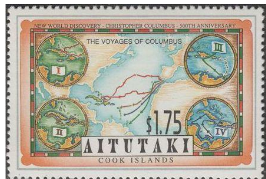
ארבעת מסעותיו של קולומבוס

מסעו הרביעי והאחרון של קולומבוס לעולם החדש החל ב-11 במאי 1502. הפעם הוא יצא לדרך עם ארבע ספינות, והגיע לראשונה למדינות מרכז אמריקה. תחילה הוא נחת בהונדורס, אחר כך המשיך צפונה והגיע לקוסטה-ריקה ולפנמה. לאחר שאיבד שלוש מספינותיו בהתקפת מקומיים הוא הפליג להיספניולה, ג'מייקה ולבסוף חזר לספרד ב-7 בנובמבר 1504. בשלב זה איבד הכתר הספרדי את אמונו בקולומבוס: התמורה הכלכלית ממסעותיו לא הצדיקה