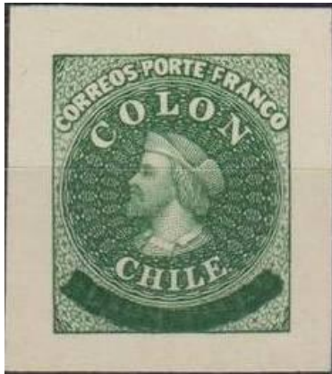
כריסטופר קולומבוס – הגהת מטבעת על קרטון של בולי צילה הראשונים משנת 1856

"אני מאמין כי זהו גן-עדן עלי אדמות, אליו ניתן להכנס ברשות האלוהים בלבד".