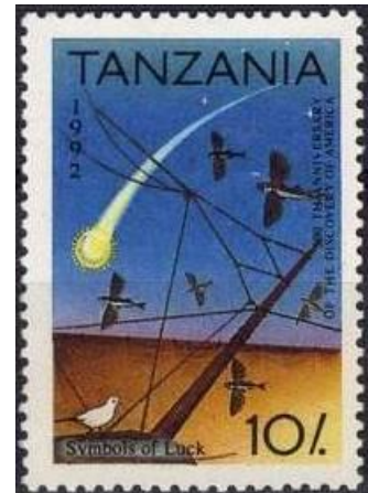
הציפורים הצביעו על הדרך

לאחר חקירת האי סאן סלבדור הפליג קולומבוס לכיוון קובה ועבר על פני שני איים "האי הארוך" וה-"אי העקום". הוא קרא להם על שם פטרוניו "איזבלה" ו"פרדיננד". היום שוכנות בו הרפובליקה הדומיניקנית והאיטי. ארבעת אתרי הנחיתה של קולומבוס ושמות האיים מופעים על גבי הגליונית מאיי בהאמה על בסיס מפה מן המאה ה-15.