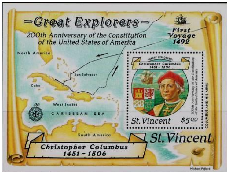
מסעו הראשון של קולומבוס

מתחרה ראויה למעצמה הפורטוגלית, אשר תישא את בשורת הנצרות והדגל של ישו אל הארצות אשר מעבר לים.