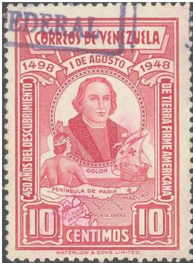
המסע השלישי של קולומבוס: מקום שפך האורינוקו לים

שניה לעולם החדש אותו גילה בראש צי ענק שמנה 17 ספינות ו-1200 איש. מגודלו של הצי ומהמהירות בה שב להפליג מערבה מלמדות שקולומבוס הצליח לשכנע את שליטי ספרד שאכן הוא הגיע להודו. בין המפליגים עם קולומבוס במסעו השני נכללו גם אזרחים, שנשלחו לישוב את העולם החדש בהיספניולה. במסעו זה גילה את האיים ג'מייקה ופורטו ריקו.