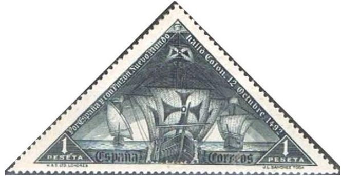
קולומבוס השתמש בספינות מדגם קרוולה

תרנים. על גבי התורן המרכזי התנוססו מפרש ראשי ומפרש עליון, ובירכתיים מפרש משולש, שסייע בהתנהלות הספינה מול הרוח. על גבי מפרשי הספינות צוירו צלבים גדולים כביטוי למיסיונריות הנוצרית.