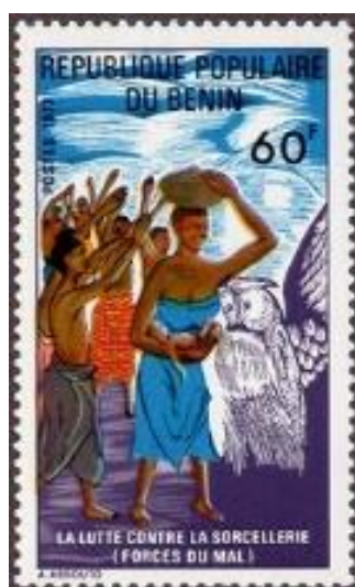
הינשוף נוכח בטקס כשפים באפריקה

מאז ומתמיד נהג האדם להתבונן בבעלי החיים ולזהות בהם תכונות מסוימות, חלקן אמיתיות (למשל, מהירותו של הצבי) וחלקן מבוססות על דימוי בלבד, אשר נגזר מטיב הקשר שבין בעל החיים לאדם. כך, למשל, האדם חשש מפני הנחש, ועל כן העניק לו תכונה שלילית של ערמומיות. לכאורה, מצבו של הינשוף צריך להיות טוב, משום שזהו בעל חיים המועיל לאדם, ובפרט לזה העוסק בחקלאות. הינשופים הם אויבים טבעיים של המכרסמים, והחקלאים למדו להעריכם ולהיעזר עליהם כשומרי אסמים.