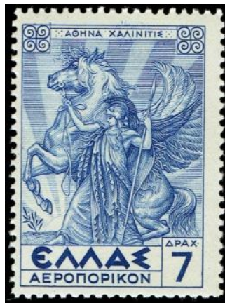
אתנה, נושאת כידון, מרסנת את פגסוס