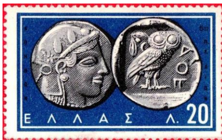
אתנה והינשוף משני צדדיו של מטבע יווני עתיק