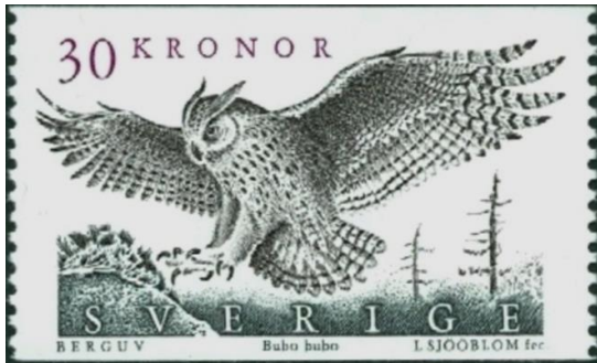
הינשוף מסתער על הטרף בטפרים שלופים

נתחיל את סיפורו של הינשוף בניתוח מקומו בעולם בעלי החיים. עולם זה מחולק למספר מחלקות, ואחת מהן היא מחלקת העופות. במחלקה זו יש מספר סדרות, ואחת מהן היא של הדורסים – עופות הניזונים מבשר של בעלי חיים אחרים. ייחודם של הדורסים היא בדרך שבה הם הורגים את טרפם. הם נוהגים לעוט על הטרף, לנעוץ בו את טרפיהם החדים, ולהצמיד אותו בחוזקה כלפי המשטח עליו