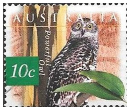
הינשוף מסתתר בשעות היום בגזע העץ

הזכרנו כבר מאפיין אחד של הינשופים, והוא הטפרים החדים שלהם. בכל רגל יש ארבע אצבעות, כאשר שתיים מהן פונות קדימה והשתיים האחרות פונות אחורה. מאפיין חשוב אחר הוא ראש גדול הניצב על גבי צוואר ארוך וגמיש. בדומה לאדם, ובניגוד לרוב העופות, עיניו של הינשוף נמצאות בחלק הקדמי של הראש, כאשר הן בולטות קדימה. העיניים הגדולות מסוגלות לקלוט גם כמויות קטנות של אור, וכך יכול הינשוף לראות בחשכת הלילה. הבלטת העיניים מאפשרת ראייה סטריאוסקופית (תלת-מימדית), והצוואר הגמיש מאפשר לינשוף לסובב את הראש יותר מחצי סיבוב לכל צד, וכמעט לראות לאחור.