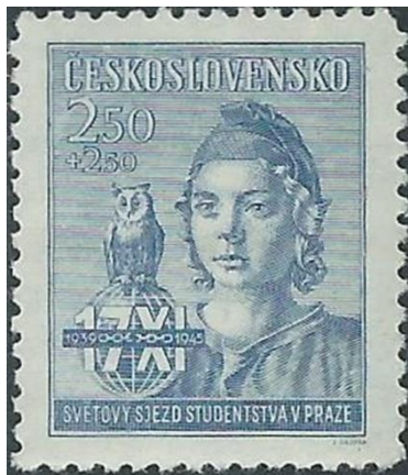
אתנה והינשוף בסמל של קונגרס רפואי

הינשוף על גבי כריכה של קונטרס טופסי מברק של חברת ווסטרן יוניון האמריקאית. פריט מרהיב ונדיר זה הוא אחד היהלומים באוסף שלי