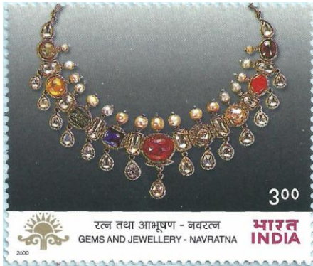
מחרוזת מהודו בה משובצות אבני חן