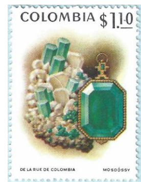
את הברקת חותכים עם פאות מקבילות

השימוש במתכות מאפשר לעצב את התכשיט לצורה הרצויה ומקנה לו ברק. אבל תוספת של אבני חן מעלה אותו לליגה אחרת לחלוטין. אבן חן היא פיסת מינרל (על פי רוב בעלת דרגת קשיות גבוהה) אותה חותכים, מלטשים ומשבצים בתכשיט. כמובן שמידת הנדירות של המינרל משחקת אף היא תפקיד, ומוסיפה לערכו של התכשיט. הפופולאריות שבין אבני החן הן היהלום, הברקת (אמרלד בלע"ז), האודם (רובי) והספיר. המעוניין לדעת יותר על אבני חן ועל אבנים יקרות למחצה מוזמן לעיין במאמר אשר פרסמתי בנושא בגיליון מספר 2 של נושאונט.