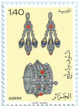
צמיד יד מצפון אפריקה

תכשיט הוא פריט דקורטיבי קטן אותו עונד האדם לצורך קישוט, כגון סיכות, טבעות, שרשרות, עגילים וצמידים. חלק מהתכשיטים מוצמדים לגוף האדם וחלקם לבגדים אותם הוא לובש.