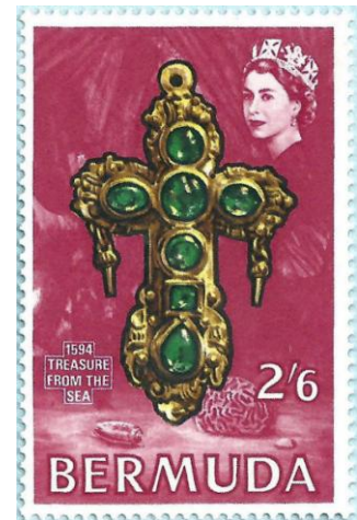
תכשיט בצורת צלב מעיד על שייכות לנצרות

הדוגמא הנפוצה ביותר לשימוש בתכשיטים לציון מעמד אישי היא טבעת הנישואים. בנוסף, תכשיט עשוי להעיד על מעמד חברתי, כגון מילוי תפקיד חשוב בקהילה (חשבו על לבושם של אנשי דת, בעיקר בנצרות). בתרבויות מסוימות נפוץ השימוש בתכשיטים כקמעות המסייעים להצלחה או הודפים את הרוע. דוגמא המוכרת לנו היטב היא הח'מסה, לה הוקדשה בשנים האחרונות סדרת בולים ישראלית.