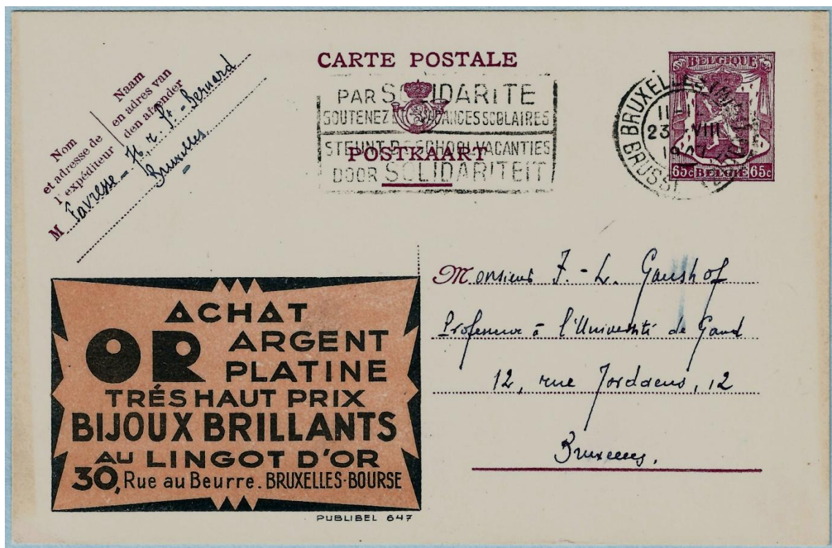
גלוית פובליבל משנות ה-40 ועליה פרסומת של סוחר מתכות (זהב, כסף, פלטינה) לתכשיטים.

החלוקה לעיל הינה, כמובן, סכמתית בלבד. תכשיטים רבים אשר להם תפקיד פונקציונאלי, כגון אבזם החגורה או סיכות לשיער, הפכו עם השנים למלא תפקיד דקורטיבי בעיקרו, כאשר חל פחות בצורך המעשי שלהם. כך נוהגים גברים רבים לחגור חגורה גם כאשר אין כל חשש שמכנסיהם יפלו.