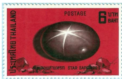
את הספיר חותכים לצורה נטולת פאות, ומלטשים כך שהאור מתפזר בצורת כוכב