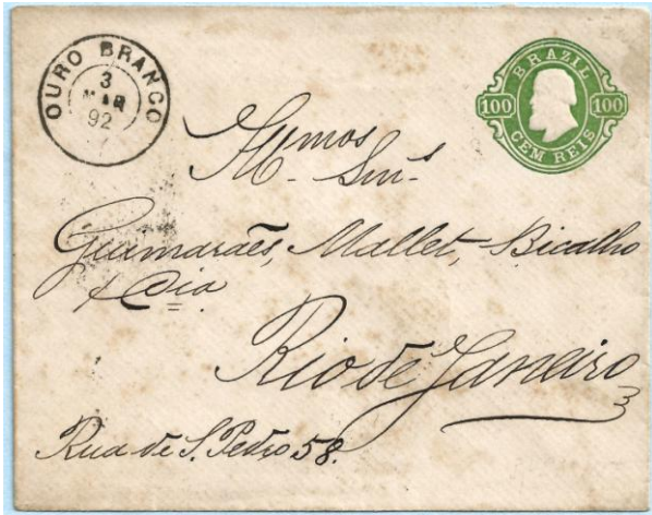
חותמת מיישוב בשם אוורו ברנקו בברזיל. משמעות השם הוא זהב לבן בפורטוגזית.

סגסוגת של נחושת ובדיל. כיום משתמשת התעשייה בעיקר בזהב, זהב לבן (סגסוגת של זהב וכסף), פלטינה, פלדיום, טיטניום וכסף.