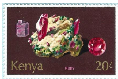
את האודם חותכים כמו ורד עם פאות משולשות