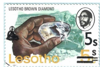
את היהלום חותכים בחיתוך בריליאנט המעצים את ההשתקפות והפיזור של האור