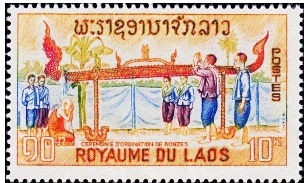
דגם של נגה משמש בטקס חניכת נזירים בלאוס

בניגוד לכך, בבודהיזם נחשבים הדרקונים, הנקראים דרקוני הנגה, כיצורי מגוונים הנותנים את חסותם לבני האדם ולרכושם. במקדשים ואתרים דתיים רבים ניתן לראות פסלי וציורי נגה שיוצרו בכדי להעניק הגנה לאתר. אחד מדרקוני הנגה המפורסמים בבודהיזם הוא המוקלינדה , שיצא מתחת לאדמה בכדי להגן על בודהה לאחר שזה קיבל הארה. בפסלים רבים ניתן לראות את בודהה מבצע מדיטציה תחת חסותו. בלאוס ובתאילנד נחשבים דרקוני הנגה כשליטי וכמגיני נהר המקונג, ורבים מיושבי גדות הנהר מעלים להם מנחה לפני שהם יוצאים לשיט כברכה להצלחת הדיג. על חשיבות הנגה תעיד העובדה, כי שנת הדרקון הסינית מכונה בארצות דרום מזרח אסיה שנת הנגה.