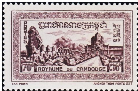
דרקון הנגה כמעקה במקדש אנגקור טום בקמבודיה