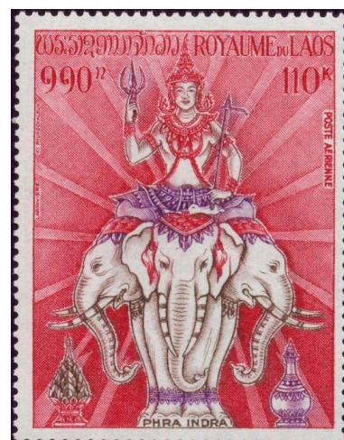
אינדרה רוכב על ארוואטה. הבול משמאל הוא תבליט אבן ממקדש בנטיי סריי, אגנקור, קמבודיה

רכבו של האל אינדרה , אל המלחמה, הגשמים והסופות. כשהאל רוצה להוריד גשמים שואב הפיל אראוואטה בחדקיו מים מתחת לאדמה ומתיז אותם לעננים, ואז פוקד אינדרה להמטיר את המים ולהשקות את האדמה. בממלכת לאוס, שהתקיימה עד 1975, נחשב הפיל בעל שלושת הראשים, הנקרא אראוואן , כדמות מגוננת וכמסמלת את איחוד שלושת הממלכות הלאיות הקדומות. הממלכה, שנקראה גם "ארץ מיליון הפילים", בחרה באראוואן כסמלה הלאומי, והוא אף הופיע על דגלה.