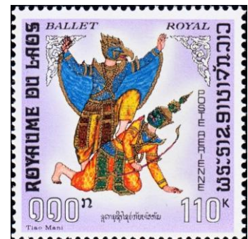
מימין: המאבק בין ג'טיו לראוואנה. במרכז: מרכבת אל השמש רתומה לגרודה. משמאל: גרודה, חברת התעופה הלאומית של אינדונזיה.