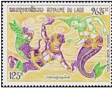
הנומן נאבק בסופאן מצאא. למעלה : בול מלאוס. למטה : גליונית מזכרת מקמבודיה

את סיטא החטופה. בת הים הצייתנית נתנה הוראה לדגים להרוס את הגשר ולמנוע בכך את מעבר הגייסות החשים להציל את אשת האל ראמה. אל הקופים הנומן נאבק עימה מתחת למים בניסיון להניא אותה מביצוע פקודתו המרושעת של ראואנה. במהלך הקרב התת ימי ביניהם התאהבה סופאן מצאא בהנומן הקוף, פקדה לחדול מהרס הגשר והתלוותה אליו במלחמתו. מאהבה זו זכינו לעוד יצור מיתי, חציו קוף וחציו דג, שהתווסף לאוסף העשיר של הדמויות המיתיות הממלאות את עולם הדמיון והפנטסיה שלנו.