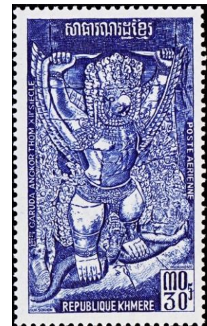
תבליט אבן של גרודה ממקדש אנגקור

העומד מול תחריטי האבן בקירות מקדשי אנגקור בקמבודיה לא יכול שלא להתרשם מעוצמתו של הגרודה , יצור בדמות עוף, לעיתים בעל פני אדם, עם אינטליגנציה וסדר חברתי כמו של בני אנוש. לגרודות כח רב היכול לגרום לסופות ולהרס במשק באמצעות משק כנפיהם בלבד. בה בעת יש להם כוח לשאת משקל עצום, ולכן הם שימשו ככלי תחבורה לאלים כמו וישנו , האל המשמר בהינדואיזם ובבודהיזם.