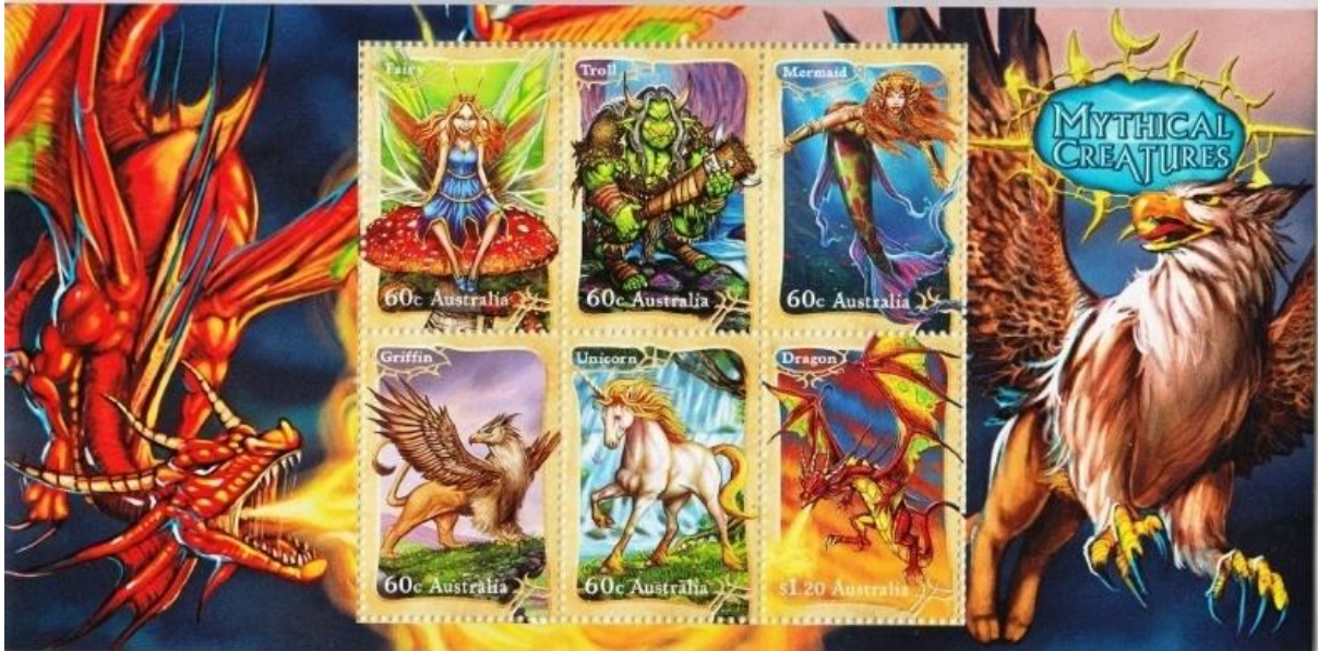
יצורים מיתיים על גבי גליונית מאוסטרליה

קנטאורים, מינוטאורים, חדי-קרן ודרקונים – מי מאיתנו אינו זוכר כיצד הציתו יצורים מיתיים אלו ואחרים את דמיוננו והעשירו את עולמות הפנטזיה בילדותנו? אין לך תרבות שבה לא התפתחו אגדות ומסורות אודות יצורים שונים ומשונים, לרוב בני כלאיים, החיים לצד בני האדם. ברוב הדתות דמיון התערבב עם מציאות, ואנשים סגדו ליצורים מיתיים אלו ואף עבדו אותם במקדשים שהקימו לכבודם.