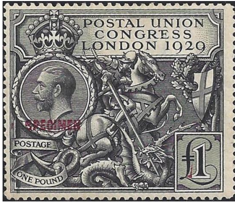
גיאורגיוס הקדוש מכניע את הדרקון. בול דוגמא