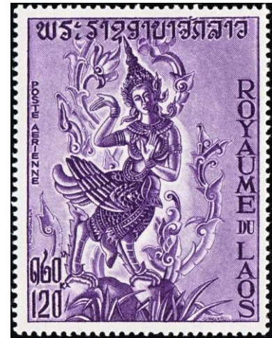
דמותה של קינרי על בולי לאוס ותאילנד

העומד מול תחריטי האבן בקירות מקדשי אנגקור בקמבודיה לא יכול שלא להתרשם מעוצמתו של הגרודה , יצור בדמות עוף, לעיתים בעל פני אדם, עם אינטליגנציה וסדר חברתי כמו של בני אנוש. לגרודות כח רב היכול לגרום לסופות ולהרס במשק באמצעות משק כנפיהם בלבד. בה בעת יש להם כוח לשאת משקל עצום, ולכן הם שימשו ככלי תחבורה לאלים כמו וישנו , האל המשמר בהינדואיזם ובבודהיזם.