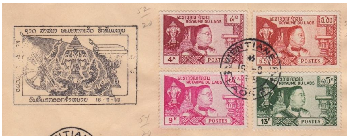
אראוואן כסמלה של ממלכת לאוס בבולים ובחותמת מלאוס

רכבו של האל אינדרה , אל המלחמה, הגשמים והסופות. כשהאל רוצה להוריד גשמים שואב הפיל אראוואטה בחדקיו מים מתחת לאדמה ומתיז אותם לעננים, ואז פוקד אינדרה להמטיר את המים ולהשקות את האדמה. בממלכת לאוס, שהתקיימה עד 1975, נחשב הפיל בעל שלושת הראשים, הנקרא אראוואן , כדמות מגוננת וכמסמלת את איחוד שלושת הממלכות הלאיות הקדומות. הממלכה, שנקראה גם "ארץ מיליון הפילים", בחרה באראוואן כסמלה הלאומי, והוא אף הופיע על דגלה.