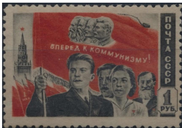
במרכז הבול למעלה: סטלין, לנין מרקס ואנגלס

בשנת 1934 הנפיקה ברית המועצות סדרה של שישה בולים לציין עשור למותו של לנין. אחד הבולים בסדרה, הנראה בתחתית העמוד הקודם, מציג את סטלין ולנין יחדיו. המסר הוא ברור: סטלין הינו יורשו וממשיך דרכו של לנין.