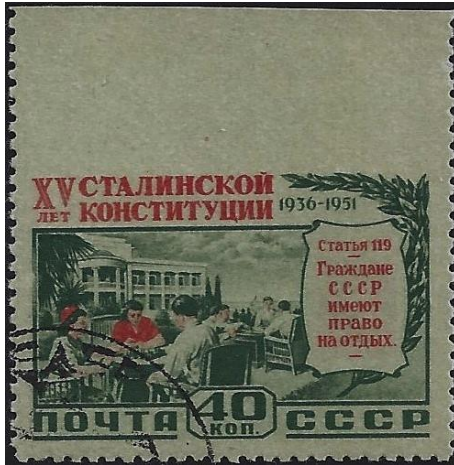
15 שנה לחוקת סטלין (כך כתוב על הבול). שימו לב לטעות ההדפסה – חסר נקבוב למעלה.

כמותה, אך כמובן שהייתה זו אחיזת עיניים בלבד. בפועל, לא יושמו הוראות החוקה אלא במידה ובאופן התואם את כוונותיו של השלטון.