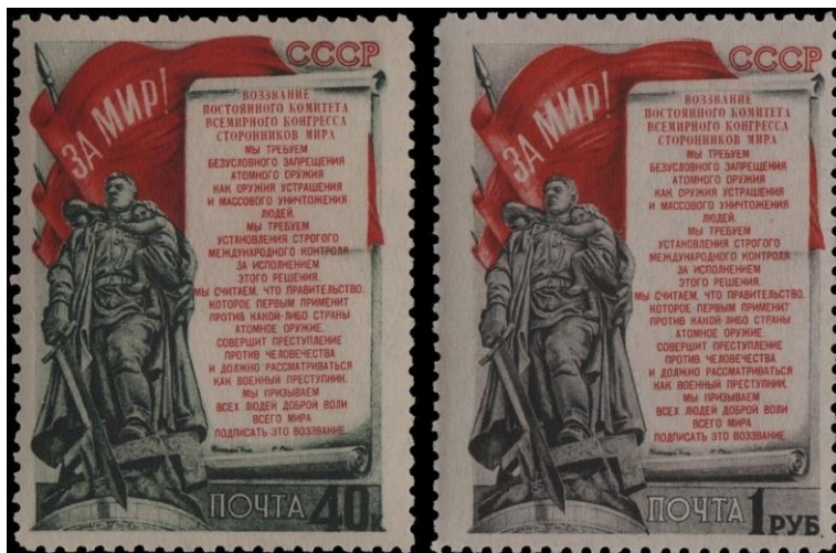
האנדרטה בפארק טרפטו

מקרה מעניין במיוחד הוא שני הבולים שהונפקו בשנת 1951, ואשר מראים את אנדרטת המלחמה הסובייטית הנמצאת בפארק טרפטו בברלין. האנדרטה מוקדשת לזכרם של הלוחמים הרוסים שמצאו את מותם בקרב על ברלין בחודשים אפריל ומאי 1945. בלב האנדרטה עומד פסלו של החייל הסובייטי המשחרר, האוחז חרב בידו האחת, כשבשניה הוא נושא ילדה גרמניה ומציל אותה ממוות. מסביב לפסל תוחמים את האזור שישה עשר סרקופגים, ועליהם תגליפים המתארים את המתקפה הגרמנית על ברית המועצות. על גבי הסרקופגים מובאים ציטוטים מדבריו של סטלין.