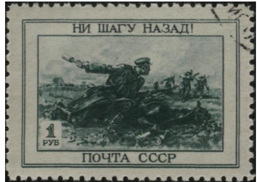
אף לא צעד אחד אחורנית!

המנהיג אינו רשום הדבר נעשה משום שמדובר במשפט כה ידוע, עד כי לא היה צורך בציון המקור. הדוגמא הבולטת ביותר היא הבול משנת 1945, המתאר את המגננה של הצבא האדום מפני התקיפה הגרמנית במלחמת העולם. בראש הבול מתנוססת הסיסמא "אף לא צעד אחורנית". לא היה בברית המועצות אפילו אדם אחד באותן שנים שלא ידע, כי זו הוראתו של סטלין, הידועה כפקודה מספר 227, לפיה אין לסגת בשום תנאי ובשום נסיבות מפני המתקפה הגרמנית. ואמנם, הצבא הרוסי הציב חיילים חמושים שאכפו את הפקודה, וירו למוות בכל מי שניסה לסגת.