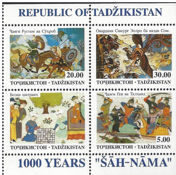
איור מספר המלכים של פירדوسی ובו לוח שחמט חלק.

על רקע זה מעניין לדעת, כי בראשיתו שוחק השחמט על לוח חלק, בעל משבצות אחידות בצבען. איננו יודעים הרבה על הנסיבות שבהן נולד השחמט, אך רוב החוקרים מאמינים, שמקורו של המשחק בהודו של המאה השישית לספירה. אחד האיזכורים הראשונים של השחמט הוא באפוס המונומנטלי "שאהנאמה"