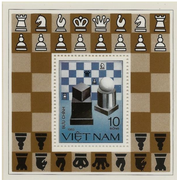
סידור נכון של הלוח והכלים

לבנה. בגיליון המזכרת מויאטנם הנראה כאן מודגם הדבר יפה. אילו היה הלוח מסובב ב-90 מעלות, הרי שהמלכים היו ניצבים על משבצות תואמות לצבעם, או שהיה צורך להחליף את מיקומם של המלכים עם המלכות. שתי האפשרויות הן בלתי נסבלות בעבור כל שחמטאי.