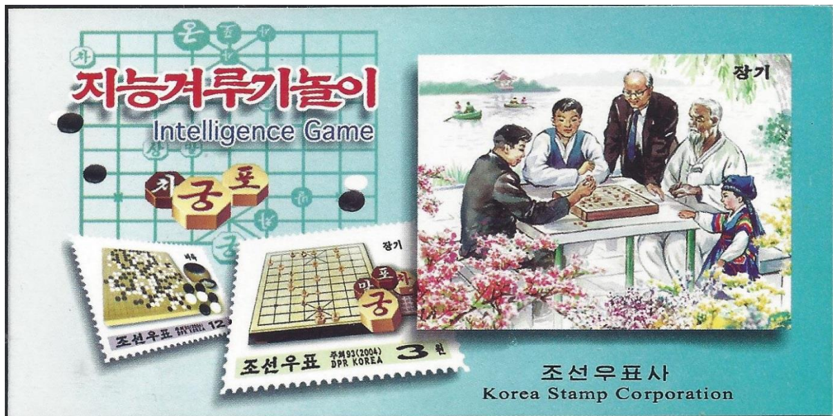
שחמט סיני משוחק על גבי לוח חלק. כריכת קונטרס.

אם נאמץ את סיפורו של פירדוסי, הנתמך גם על ידי מקורות אחרים, הרי שהשחמט נדד מהודו לפרס, משם לעולם המוסלמי וממנו לאירופה. במקביל נפוץ השחמט גם מזרחה והגיע לסין וליפן. הגרסה הסינית של השחמט, הקרויה שיאנג-צ'י, משוחקת אף היא על גבי לוח חלק, כפי שרואים על כריכת הקונטרס מקוריאנה.