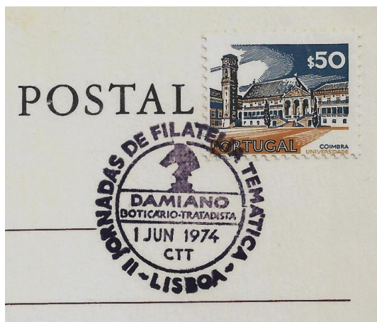
חותמת לזכרו של דמיאנו

מכתב שנשלח משיקגו, אילינוי בשנות ה-70 של המאה ה-19 (25 בפברואר, ללא ציון השנה) עם חותמת קשוחה (fancy cancellation) בצורת לוח משובץ בגודל 6X7. לא ידועה גרסה של שחמט אשר שוחקה על לוח בגודל כזה. למרות הדמיון הצורני אין לחותמת כל קשר למשחק השחמט.