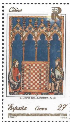
עמוד מתוך ספרו של המלך אלפונסו העשירי.

אז מתי והיכן הוחלט שלוח השחמט צריך לקבל את המבנה המשובץ המוכר לנו כיום? ככל הנראה זה קרה באירופה של ראשית המילניום הקודם. באותה תקופה כבר היה מוכר באירופה משחק הדמקה, הגם שהוא שוחק על לוח קטן של 5 X 5. האירופאים נהגו לשחק דמקה על גבי לוח משובץ, דבר שהינו הגיוני למשחק שבו האלכסונים הם קווי המשחק היחידים. ככל הנראה צורת הלוח המשובץ הועתקה מהדמקה אל המשחק החדש, שחמט. בשנת 1283 נכתב "ספר השחמט, הקוביות ומשחקי הלוח" לפי הזמנתו של אלפונסו העשירי "החכם", מלך קסטיליה. בספר יותר מ-100 בעיות שחמט מאוירות, ובכולן מוצג המשחק על גבי לוח משובץ.