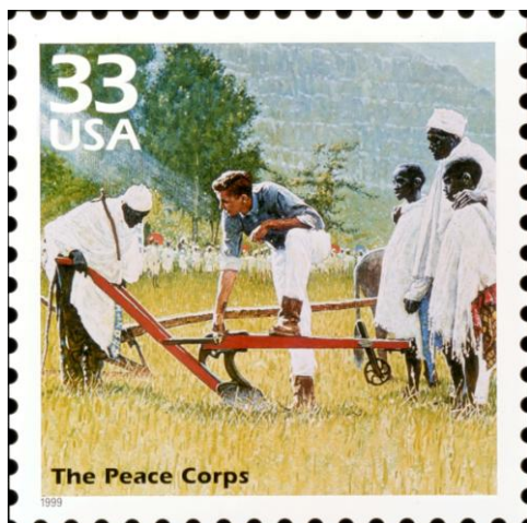
חיל השלום באתיופיה

כאשר הצטרפה ארצות הברית למלחמת העולם הראשונה ביקש נורמן רוקוול להתגייס לשורות הצי האמריקאי ולשרת את ארצו. הוא נדחה, משום שסבל מתת משקל. הוא בילה לילה שלם באכילת בננות וסופגניות ובשתיית נוזלים, ולמחרת הצליח לעמוד בדרישת המשקל. אולם הוא סווג כבעל בריאות לקויה, ושימש כאמן צבאי.