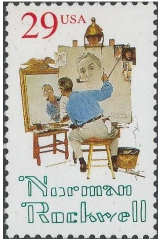
דיוקן עצמי משולש

נורמן רוקוול הלך לעולמו בשנת 1978 והוא בן שמונה וארבע. קרוב לביתו, בסטוקבריידג' מסצ'וסטס, קיים מוזיאון המוקדש ליצירתו ובו קרוב ל-600 עבודות מפרי מכחולו.