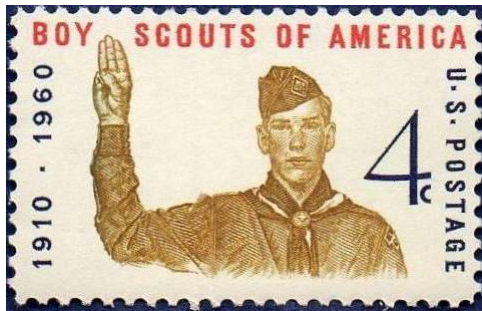
בול אמריקאי שהוקדש לצופים עושה שימוש באחד מאיוריו של רוקוול.

ההתפתחות של אמנות הציור במאה העשרים לכיוון הסוריאליסטי והאבסטרקטי חידדו את ההבדל שבין צייר למאייר. הראשון הוא מי שיוצר אמנות של ממש, בעוד שעבודתו של האחרון רק מלווה טקסטים כתובים. המאייר הוא, אולי, ברוך כשרון, אך אין לו הגד משל עצמו. המאייר הוא בעל יכולות טכניות גבוהות, אך הוא נעדר סגנון אמנותי משל עצמו. הזכרו נא בספרי הילדים אותם קראתם בילדותכם: מדוע, לרוב, אתם זוכרים את שם הסופר ולא את שם המאייר?