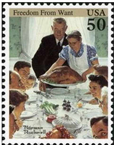
חופש מפני מחסור

פוסט" נוסד בשנת 1821, והיה השבועון הנפוץ ביותר בארצות הברית של ראשית המאה העשרים. עורכו המיתולוגי של השבועון, הוראס לורימר , גילה את רוקוול בשנת 1916. רוקוול היה אז אלמוני למדי, אך לורימר זיהה את כשרונו הרב של הצעיר בן העשרים ושתיים, והזמין ממנו ציור שער לעיתון. בכך החל קשר שנמשך כמעט חמישים שנה, במהלך אייר רוקוול 321 שערים עבור המגזין. עבודות אלו היקנו לו פירסום רב, והוא הפך לאחד האמנים המוכרים ביותר בארצות הברית. גם במקרה זה אין ספק כי הקשר ארוך השנים בין רוקוול והשבועון הסתמך לא רק על אינטרס כלכלי: רוקוול היה שותף לסולם הערכים השמרני של האכסניה במסגרתה פעל.